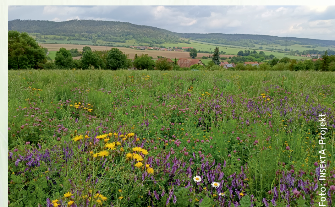
Artenreiche Leguminosenfläche in Reinstädt.