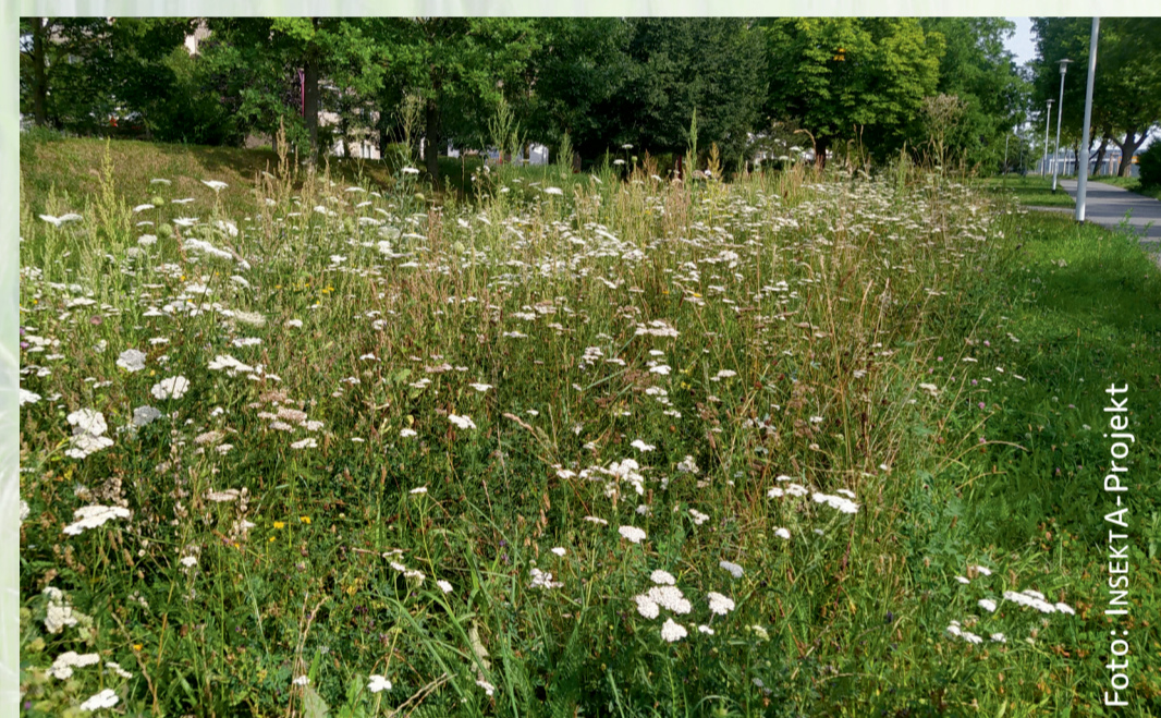
Blühender Saum im Stadtgebiet.